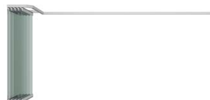
Paneles en la estación de aparcamiento Painéis na estação de estacionamento