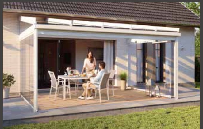
Terrassendächer Terrace roofs