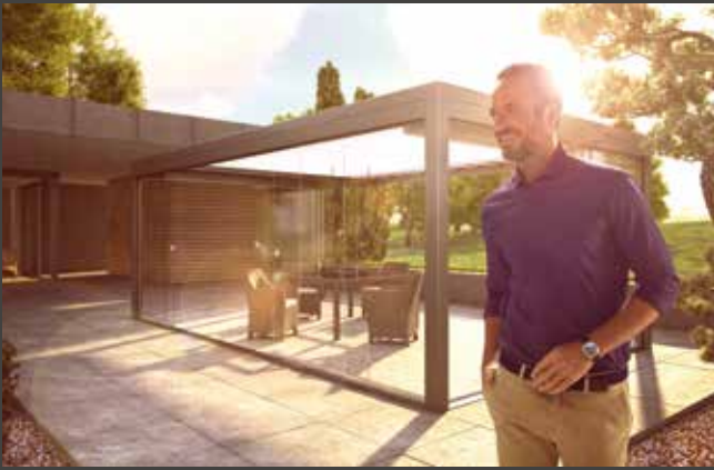
Schiebe-Systeme Sliding Systems