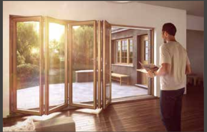
Holz-Faltwand Timber Folding Door