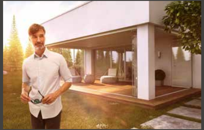
Schiebe-Dreh-Systeme Slide and Turn Systems