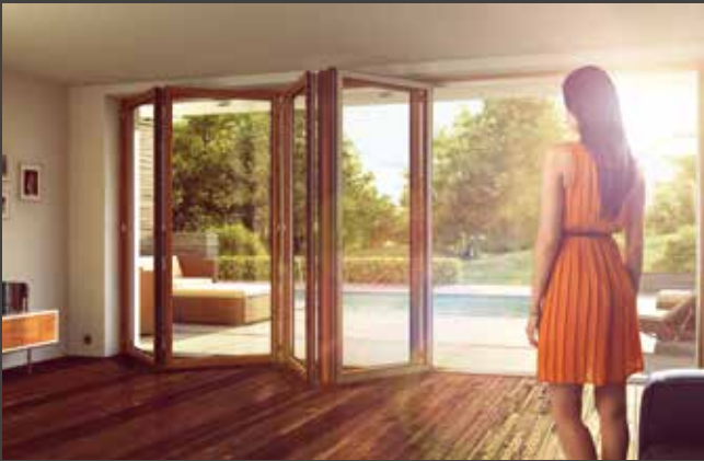
Falt-Schiebe-Systeme Folding Door Systems