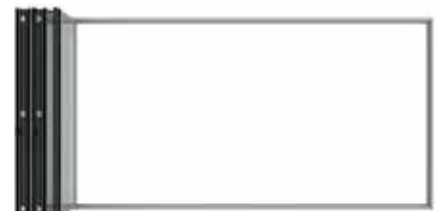
Parken der Faltpflügel Parking of the folded panels