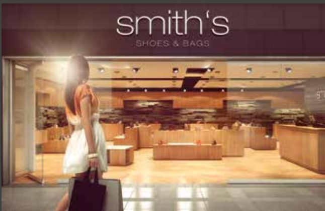
Horizontal-Schiebe-Wand-Systeme Horizontal Sliding Wall Systems