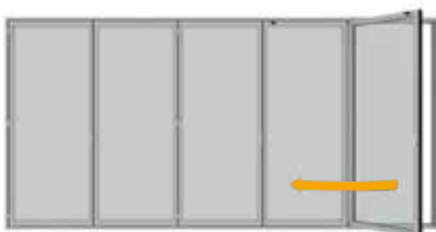
Leichtes Öffnen des äußeren Flügels Easy opening of the first panel