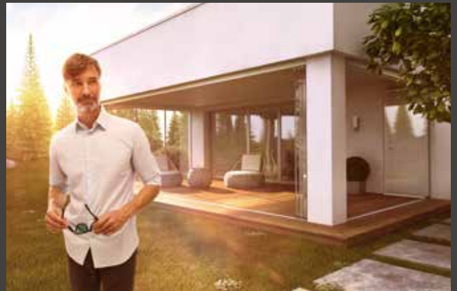
Schiebe-Dreh-Systeme Slide and Turn Systems