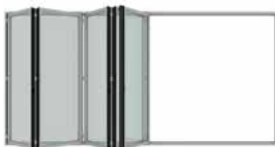
Faltung der verbundenen Elemente Folding of the connected elements