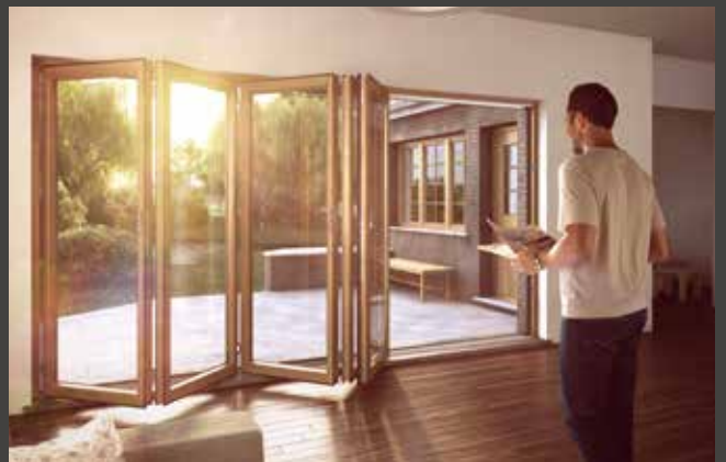
Holz-Faltwand Timber Folding Door