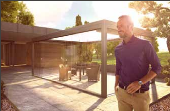
Schiebe-Systeme Sliding Systems