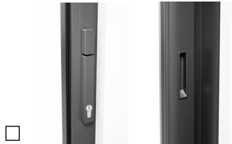
Mit Profilzylinder, Drehknopf innen, Schiebegriff innen, mit Muschelgriff außen