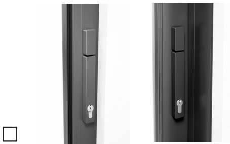
Mit Profilzylinder (Voll-PZ), Drehknopf innen + außen, Schiebegriff innen + außen

Verriegelung innen: in Anlagenfarbe (Standard) Sonderfarbe: _____