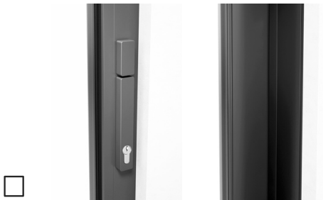
Mit Profilzylinder, Drehknopf innen, Schiebegriff innen, ohne Muschelgriff außen