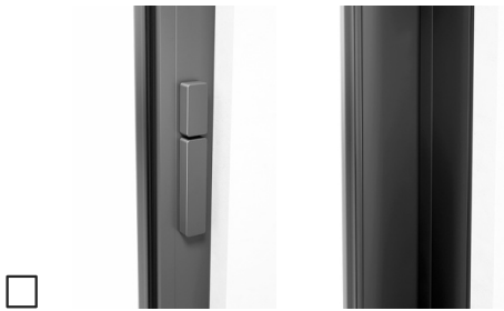
Ohne Profilzylinder, Drehknopf innen, Schiebegriff innen, ohne Muschelgriff außen