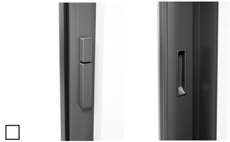
Ohne Profilzylinder, Drehknopf innen, Schiebegriff innen, mit Muschelgriff außen